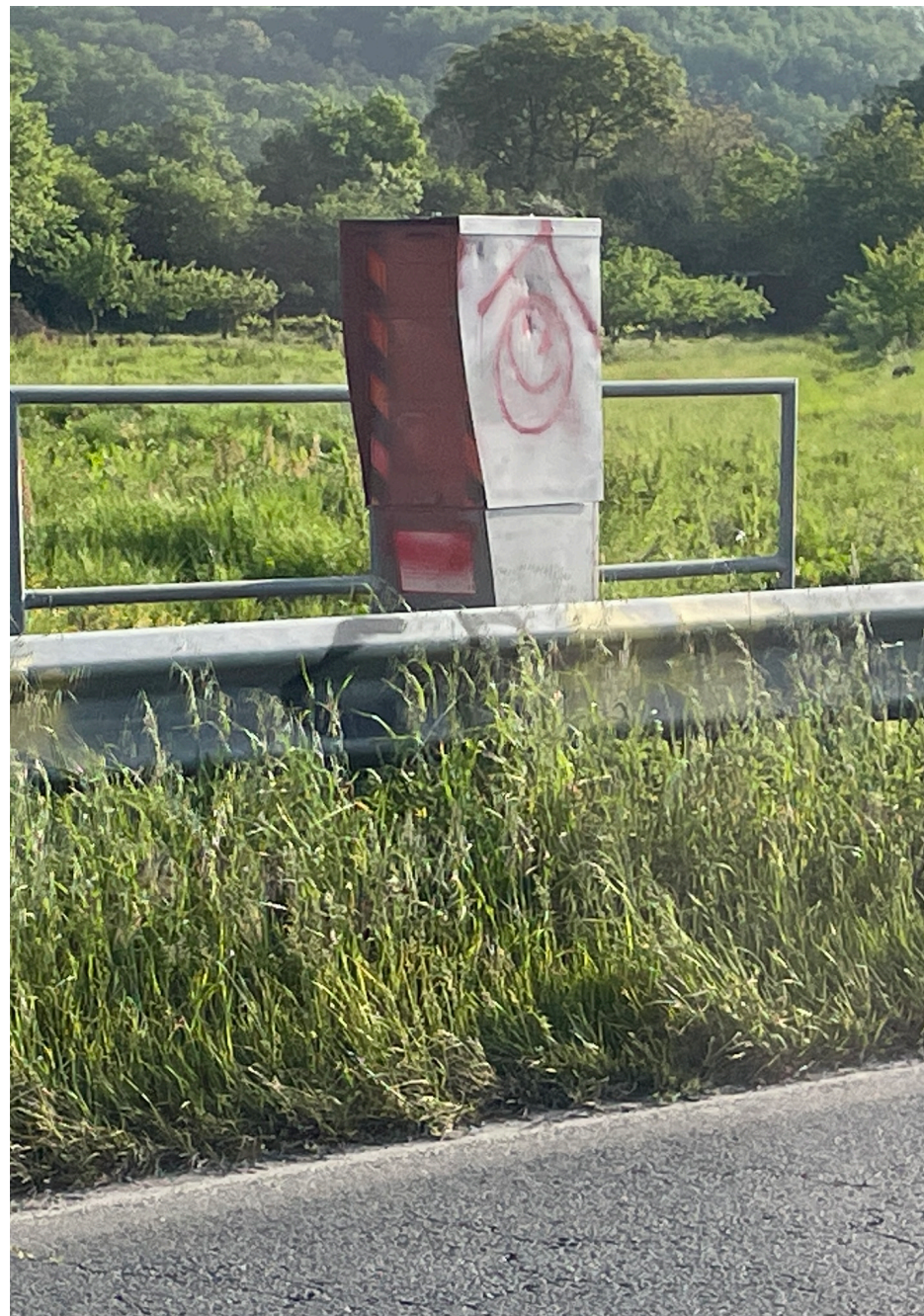
Mendlesham Computer Club